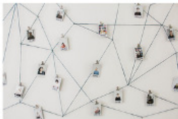
Was macht Deine Arbeit so spannend?