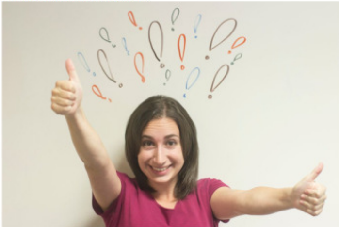
Welche Aufgaben hast Du?

#Sponsored Post: Blindtext indtext Blindtext Blindtext Blindtext Blindtext Blindtext Blindtext Blindtext Blindtext Blindtext Blindtext Blindt indtext Blindtext Blindtext Blindtext Blindtext Blindtext Blindtext Blindtext Blindtext Blindt indtext Blindtext Blindtext Blindtext Blindtext Blindtext Blindtext Blindtext Blindtext Blindtext Blindtext Blindt